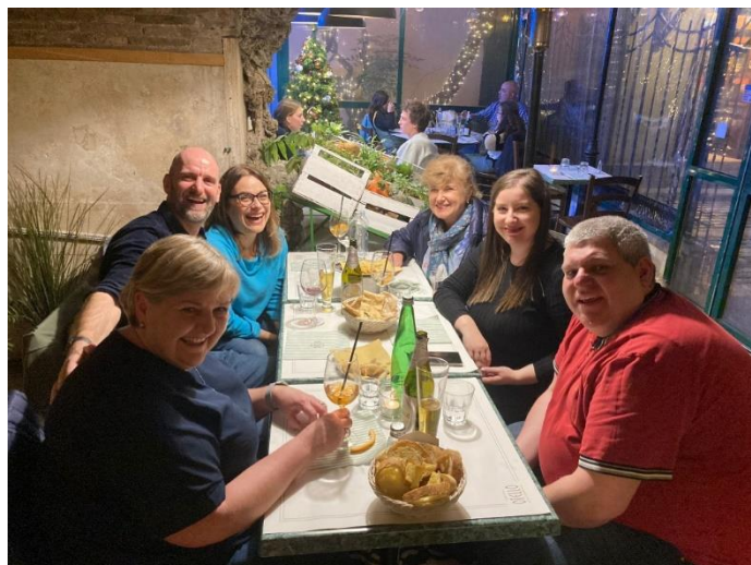
Il nostro fantastico team del progetto Family-School Network